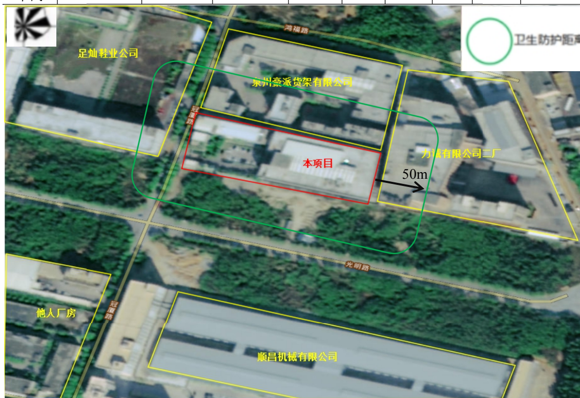
图 4-1 项目卫生防护距离

根据《制定地方大气污染物排放标准的技术方法》(GB/T 3840-91)中,卫生防护距离在 100m 以内时,级差为 50m;无组织排放多种有害气体的工业企业,按 Qc/Cm 的最大值计算其所需卫生防护距离;但当按两种或两种以上的有害气体的 Qc/Cm 值计算的卫生防护距离在同一级别时,该类工业企业的卫生防护距离级别应提高一级”。因此,本项目厂房卫生防护距离取值 50m。本项目无组织排放的卫生防护距离为厂外延 100m 范围。该卫生防护距离范围内主要为工业企业,无食品加工厂、居民区、学校、医院等大气敏感项目,可以满足环境防护距离的要求。