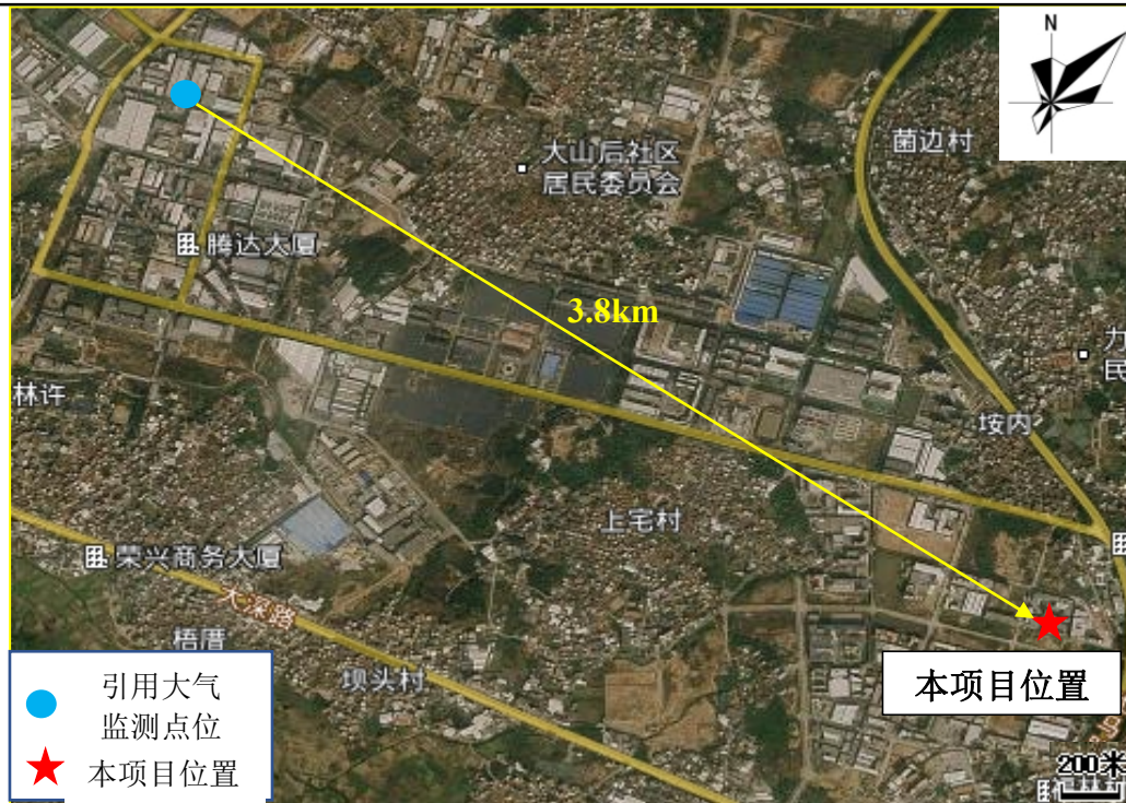
图 3-1 大气现状监测点位图